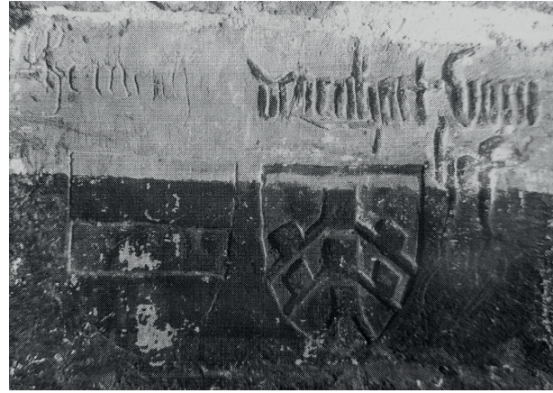
Abbildung 1: Balkenwappen mit dem Namenszug „Heinrich“ neben dem Wappen des Degenhart des Hofer im Katharinenkloster auf der Sinai-Halbinsel. 39

Doch Heinrich Tuschl nutzte meist einen fünfblättrigen Lindenzweig, 44 das eigentliche Familienwappen der Tuschl. Erst in den 1360er Jahren scheint sich das Wappen zu wandeln. 45 Während Schweiker II. Tuschl, der