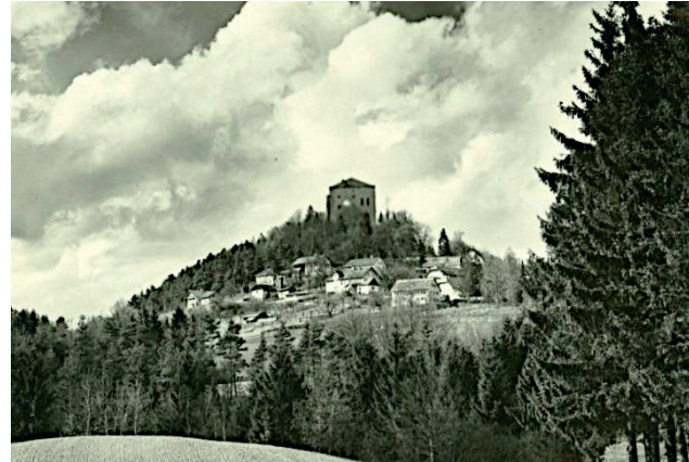
Abbildung 4: Die Saldenburg, auch als „Waldlaterne“ bezeichnet.