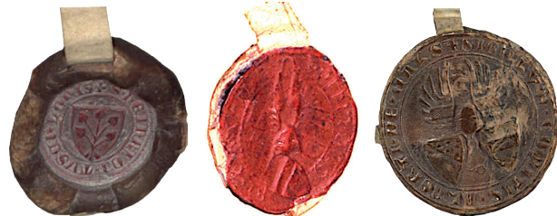
Abbildung 2: Siegel von Heinrich Tuschl 1347 mit dem fünfblättrigen Lindenzweig 40 Siegel des Peter Tuschl 41 1381 mit Balkenwappen, darüber ein Helm mit zwei Flügeln. 42 Siegel des Grafen Albrecht von Hals von 1296 mit zwei Schilden, eines davon mit Balken, darüber ein Helm mit zwei Flügeln. 43

Bruder von Heinrich, 1363 noch mit dem fünfblättrigen Lindenzweig siegelt, 46 benutzt er 1364 bereits ein Balkenwappen mit einem Helm und zwei Flügeln. 47 Dieses Wappen nutzt auch Peter Tuschl 1381. 48 Der Wechsel des Wappens vollzog sich also in den unterschiedlichen Familienzweigen gemeinsam. Das neue Wappen ähnelt sehr dem Wappen der Grafen von Hals, die ein Wap-