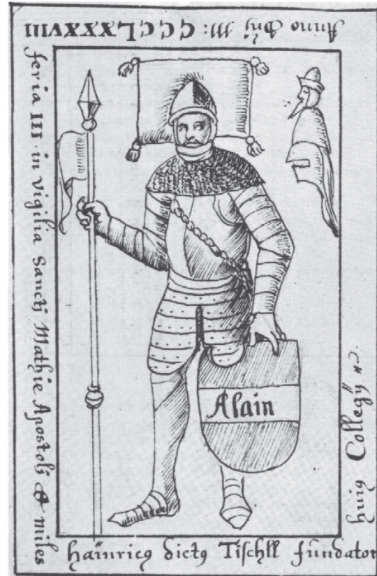
Abbildung 3: Zeichnung des verschollenen Grabsteins. 55

Ein weiteres Indiz, das für einen Aufenthalt Heinrich Tuschls in der Levante spricht, ist die Bauform der Saldenburg. 1368 erhielt er den Auftrag, im Bayerischen Wald die Saldenburg zu errichten. Der Baustil der Burg 56 mit einem großen, rechteckigen Wohnturm, wie einem „granitenem Würfel“ 57 , ist außergewöhnlich und in Deutschland selten. Diese Bauform findet sei-